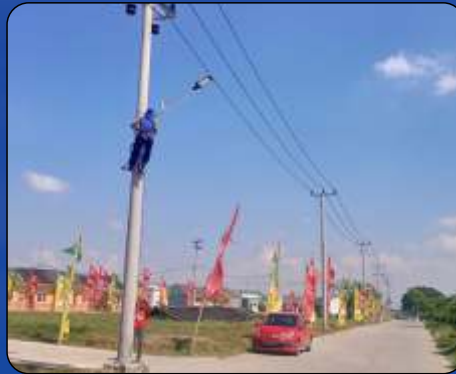
Tiang dan Lampu Solarcell Grand Cikarang City 2