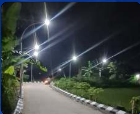
Tiang dan Lampu AC Vinewood Babelan