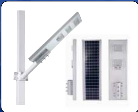
Lampu LED Solarcell All In One