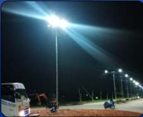
Tiang dan Lampu Solarcell Griya Alam Nusantara Cileungsi