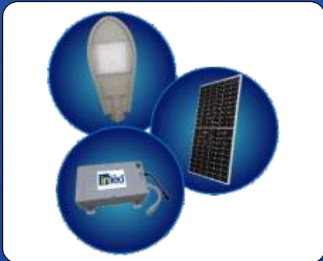
Lampu LED Solarcell