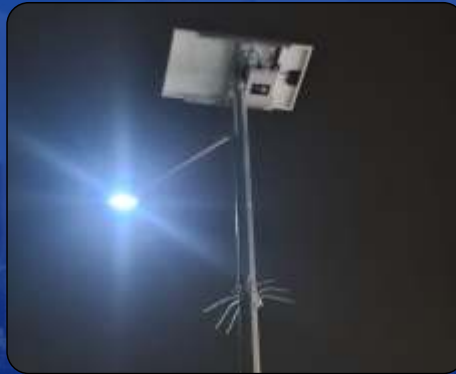
Tiang dan Lampu Solarcell Kab. Lahat Sumatera Selatan