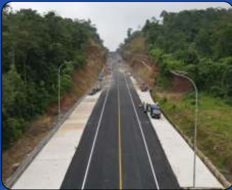
Tiang dan Lampu Solarcell Kuningan Jawa-Barat