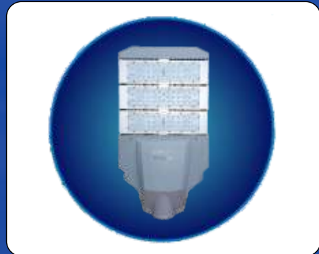
Lampu LED AC E-Catalog