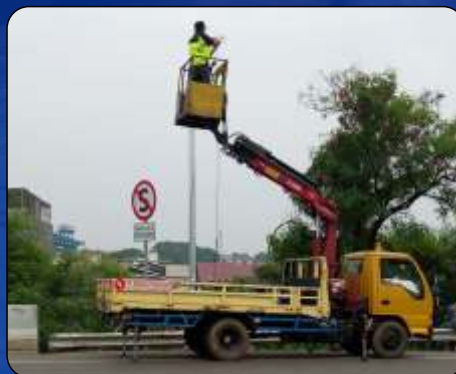
Tiang Traffic Count Tol Cakung Jakarta