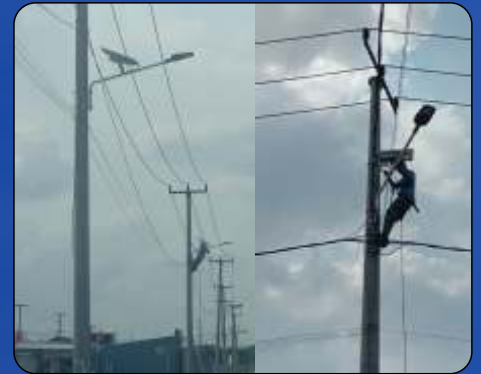
Tiang dan Lampu Solarcell Grand Vista Cikarang