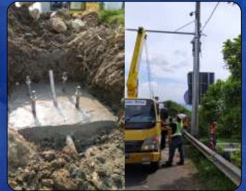
Tiang CCTV (Pondasi & Errection) Tol Purbaleunyi